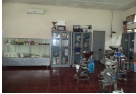
Gambar Fasilitas Laboratorium Pengolahan Hasil Pertanian