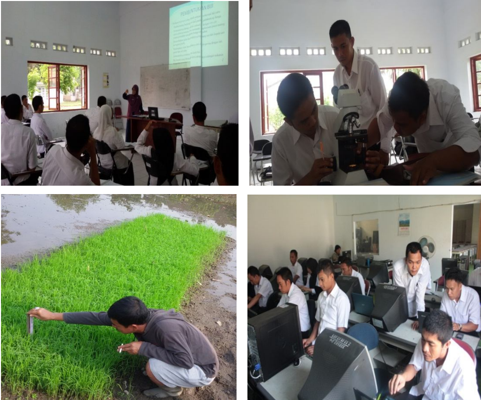
Gambar Kegiatan Perkuliahan

dipilih oleh mahasiswa untuk meningkatkan kreativitasnya, antara lain: kegiatan olahraga, kesenian, penyuluhan dan lain-lain.