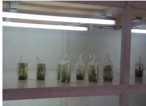
Gambar Fasilitas Laboratorium Kultur Jaringan